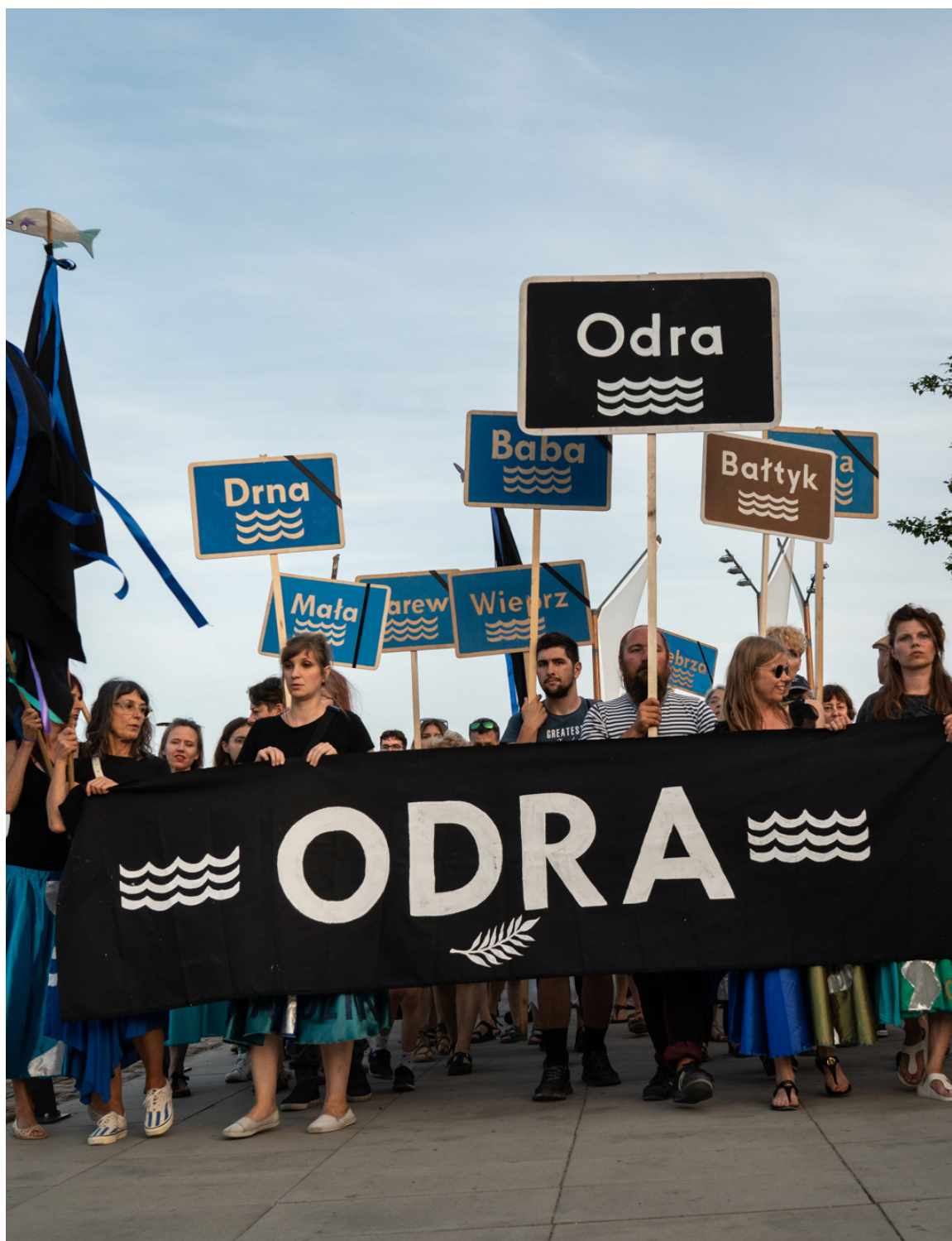
^ Rys. 5 Kondukty żałobne za Odrą, Warszawa.