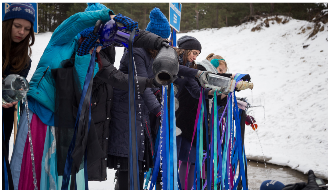
^ Rys. 4 Siostry Rzeki wlewające wodę do wyschniętego koryta Sztoty (Źródło: Stan Barański, dzięki uprzejmości Cecylii Malik; CC BY 4.0, via Wikimedia Commons).