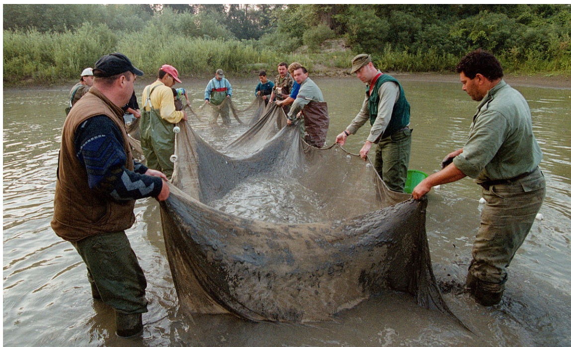
^ Rys. 2 Wyciek cyjanku do rzeki Cisa w 2000 r..

jako życie biologiczne, złoto promieni słonecznych jako system podtrzymujący życie i wreszcie cyjanek jako śmierć (Lazar i Kiss 2002). Symbolika odnosiła się zarówno do patriotyzmu, jak i solidarności, opierając się na narracjach transformacji politycznej ("polityczne życie martwych ciał") jako sposobie upolitycznienia natury ("polityczne życie martwych ryb"; Harper 2005). Społeczności dotknięte zamknięciem łowisk z powodu zanieczyszczenia stały się bardziej aktywne społecznie, np. zwiększając swój udział w samorządzie lokalnym, działalności organizacji pozarządowych i działalności na własne potrzeby (Lazar i Kiss 2002).